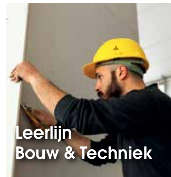
Leerlijn Bouw & Techniek