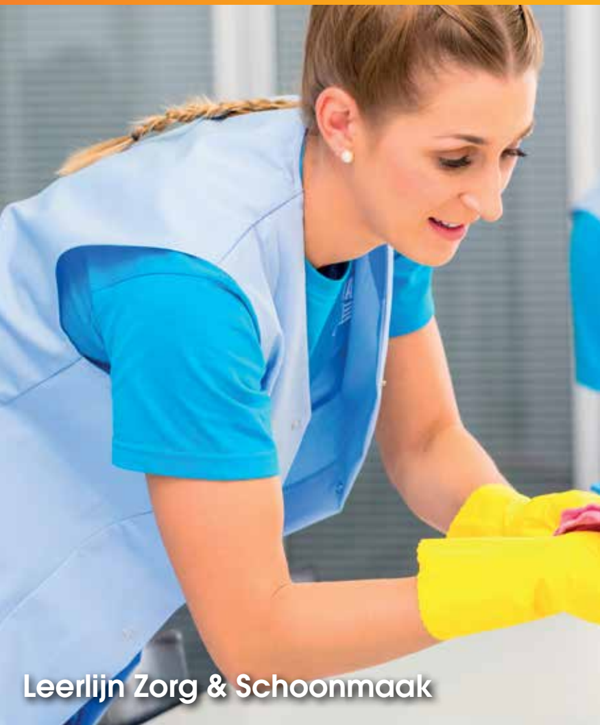
Leerlijn Zorg & Schoonmaak