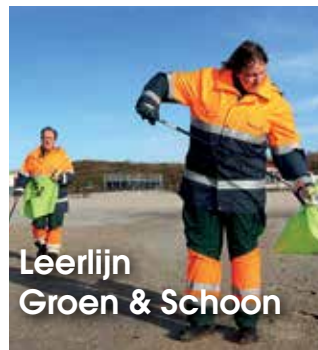
Leerlijn Groen & Schoon